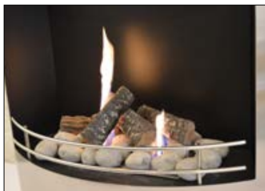
Keramikstenar till etanolkamin