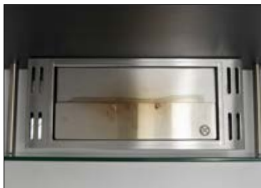
Metallplattan täcker öppningen och kväver elden.