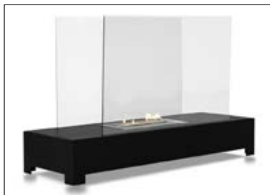
Fristående etanolkamin med 1,5L brännare. Brinntid 2,5 – 3 timmar