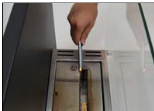
Antändning av bioetanol