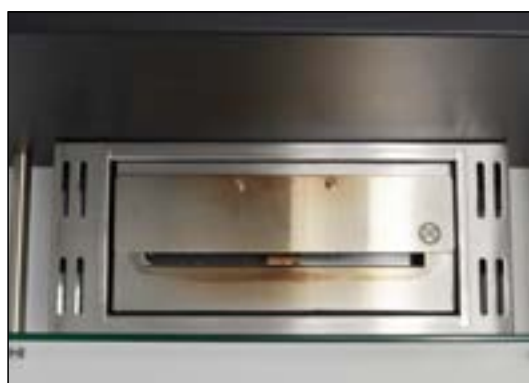
Metallplattan täcker halvvägs av öppningen och ger en mindre flamma.