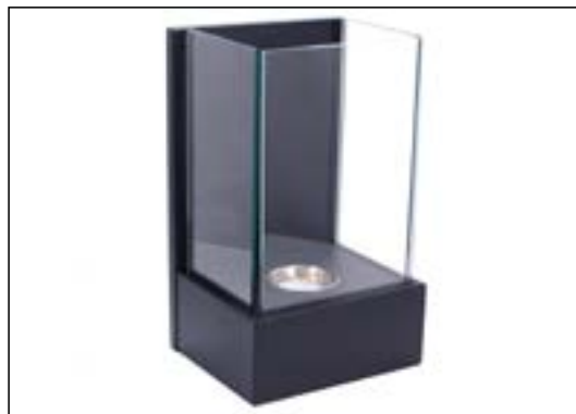
Väggkamin med 0,3L brännare. Brinntid: 1 timma

Lär mer online angående bioetanol konsumering och hur mycket det kostar att ha en etanolkamin tänd.