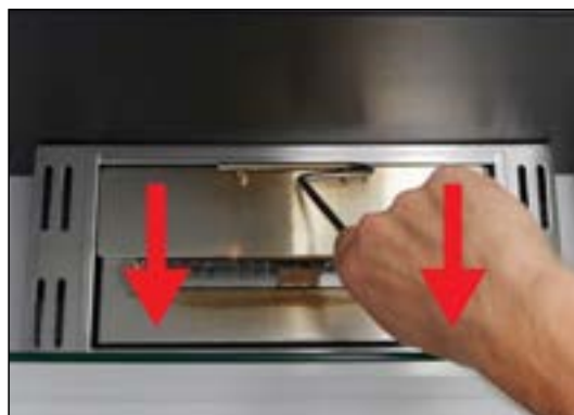
Släck elden genom att dra metallplattan över brännarens öppning.

Läs mer online om Hur man släcker och reglerar flammen i en etanolamin.