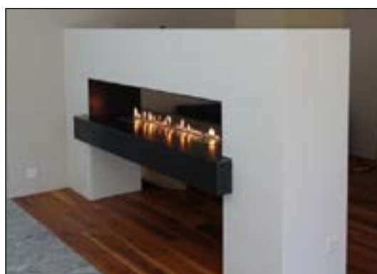
15L Automatisk etanolkamin. Brinntid 9-10 timmar