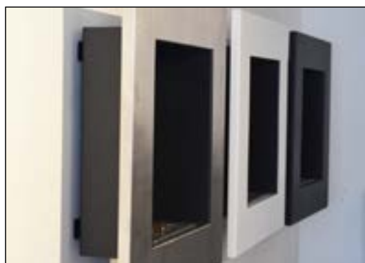
Mellanrum mellan vägg och etanolaminer