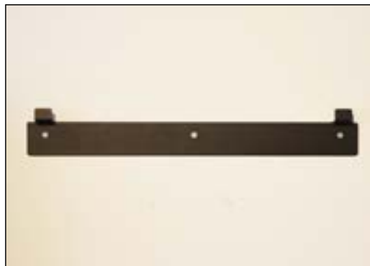
Väggfäste för vägghängande etanolaminer

Monteringen av en etanolamin görs på ett ungefär samma sätt som monteringen av en tv. Med våra större väggmonterade etanolaminer finns ett monterat fäste där etanolaminen enkelt monteras. Alternativt är våra mindre väggmonterade etanolaminer monterade med inneslutna skruvar som skruvas direkt in i väggen. Du bör vara medveten om att en typisk väggmonterad etanolamin väger mellan 10-15 kg, därför är den relativt lätt att montera på väggen. Vid beställning av etanolaminer från Etanolamin-shop.se , bifogar vi alltid illustrationer som visar hur etanolaminen ska monteras tillsammans med nödvändiga skruvar och fästen.