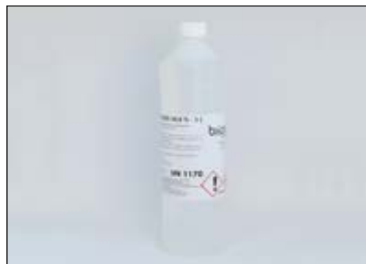
Bioethanol 1 Liter

Bioetanol är ett organiskt material. Den är framställd av sockerbeter, potatis och majs; Den består främst av alkohol som är anslutningen till att den kan förbränna. Bioetanol fungerar dessutom som tillsats till bensin, eftersom den anses vara ett miljöalternativ till andra energikällor. Den mysiga atmosfären med bioetanol, jämfört med traditionell vedeldad spis, kan därför anses vara miljömässigt korrekt, eftersom utvinningen av CO_2 minimeras avsevärt. Det är också därför bioetanol-biltjänster anses vara ett alternativ till dagens bensinbilar. Bioetanol är så ren att den inte avger någon sot eller äcklig lukt. Det är också på grund av denna faktor att det är möjligt att förbränna bioetanol i en etanolkamin inomhus såväl som utomhus