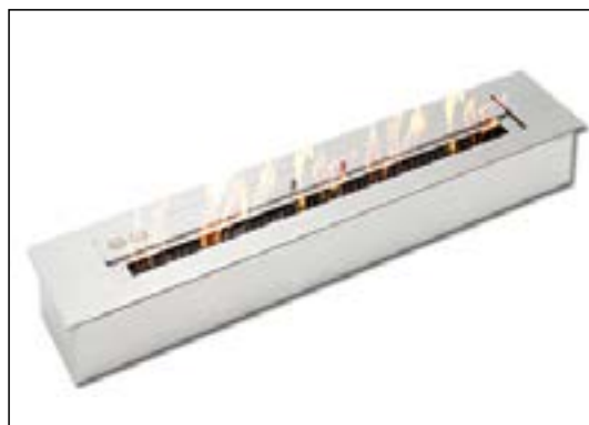
Brännare till bioetanol

Läs mer online om etanolamin inbyggingsmål och säkerhetsavstånd här.