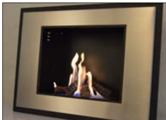
Keramikträ till etanolkamin

När du köper tillbehör har du också möjlighet att köpa specifik lukt till bioetanol. Välj din favorit lukt och förbättra den avslappnade atmosfären.