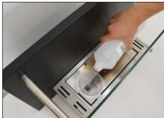
Påfyllning av bioetanol

Lär mer online om Påfyllning av bioetanol och Hur man tänder en etanolkamin här .